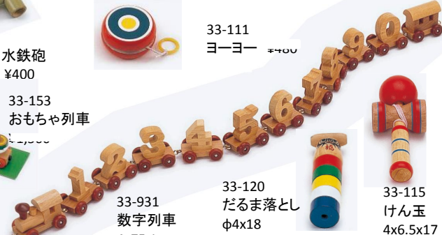
33-120 だるま落とし φ4x18