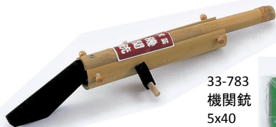
33-783 機関銃 5x40