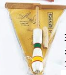
33-013 糸引トンボ 15X20