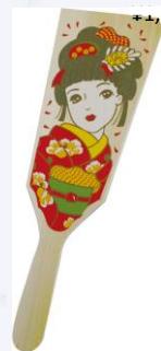
33-087-01 子供羽子板No.1 11.5X37