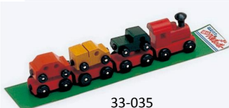
33-035 連結列車 4x24