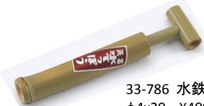
33-786 水鉄砲 φ4x29 ¥400