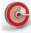
33-034 紅コマ 01(大)φ9 02(中)φ7 03(小)φ5