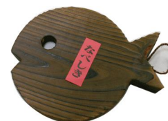
27-205 鍋敷さかな 18x14.5