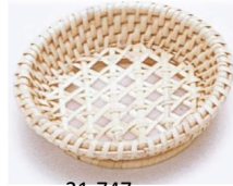
21-747 籐六ツ目 m φ8