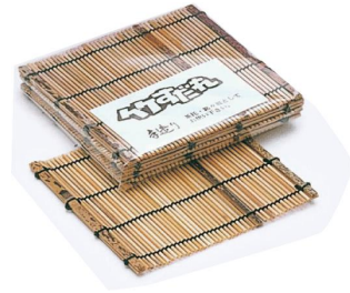
21-754 虎スダレ (バラ) 11x11 21-754-05 (5Pセット)