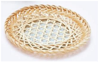
22-610 m 六ツ目茶托 φ10