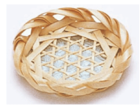
21-750 荒六ツ目 φ8