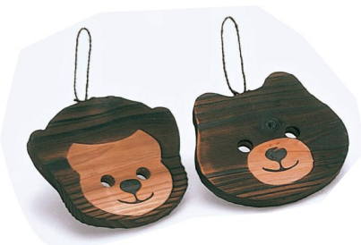
27-200 鍋敷サル 16x14.5