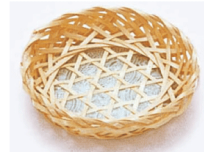
21-702 m 六ツ目 φ8