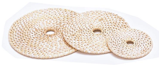
27-100 籐マット丸 c 01(大)φ18 02(中)φ15 03(小)φ10