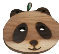
27-202 鍋敷パンダ 16x14