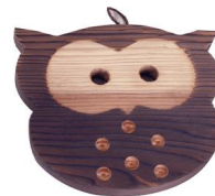
27-204 鍋敷ふくろう 16x14 ¥630