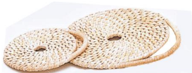
27-101 籐マット耳付 c 02(中)φ15 03(小)φ10