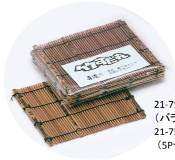
21-751 炭化スダレ (バラ)11x11 21-751-05 (5Pセット)