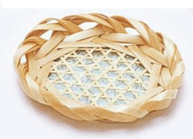
22-640 m 荒六ツ目茶托 φ10