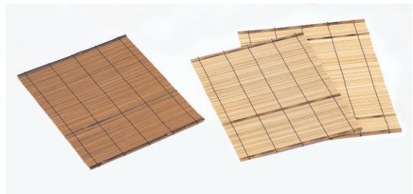
炭化会席スダレc 27-220 01(大) 45x33 03(小) 40x30