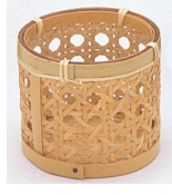
23-857 フキンハツ目 φ7x6cm