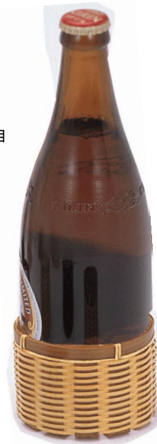
24-842 ビールゴザ目 φ9x6cm