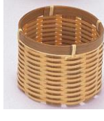
23-855 フキンゴザ目 φ7x6cm