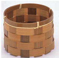
24-740 ビール広スス丸 フィア8.5x6cm