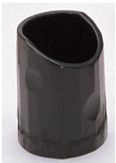
25-200 染カット φ4x6cm