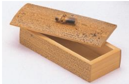
25-847 胡麻フタ付 10x5cm