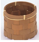
23-764 フキンスス丸 φ7x6cm