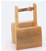
25-846 胡麻手桶 5x8.5cm