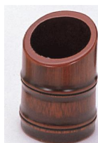
25-853 紅カット φ5x7cm