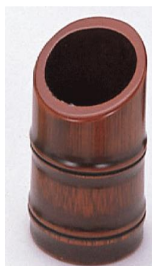
25-852 紅カットシュガー入 φ5x10cm