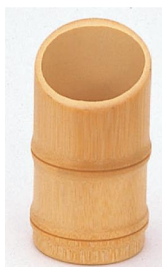
25-702 ハス切フォーク立 φ5x10cm