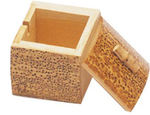
36-107 胡麻フタ付薬味入 6.5x5x6cm