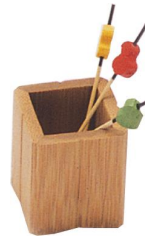
25-810 スス磨楊枝立 4x4x5cm