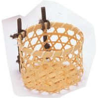
23-700 フキン背負籠 φ7x7cm