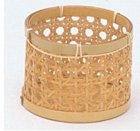
24-741 ビール籐ハツ目 φ9x7cm