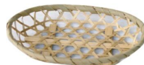
19-029 六ツ目小判皿c 13x18x3.5