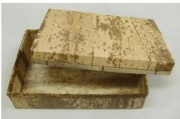
19-021 竹皮容器c 01 身 18x14x4.5 蓋 19x13x2 02 身 21x13x5.5 蓋 22x14x2