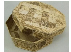
19-023 竹皮容器 八角 15.5x4.5