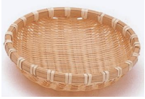
トーフザルc 19-013 φ15x4 19-014 φ13x4