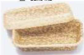
19-020 竹皮プレス容器c 20x12x5