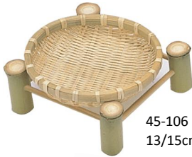
45-106 ザルスタンド 13/15cm用