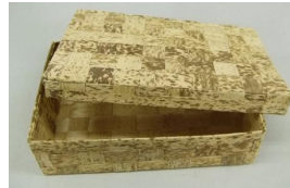
19-022 竹皮容器c 01 身 18x12x5 蓋 19x13x2 02 身 22x9x4 蓋 23x10x2 03 身 25x12x4 蓋 26x13x2 04 身 15x10x4.5 蓋 16x11x2