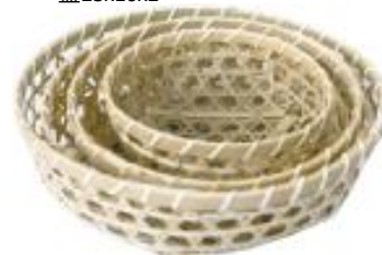
六ツ目ザルc 19-031 07 φ21x4.5 06 φ18.5x4.5 05 φ16x4 04 φ13x3.5