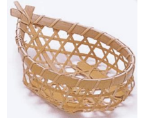
19-119-03 晒六ツ目舟(小) 13x9x3.5