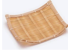
19-009 松花四海波 11x11