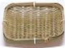
19-903 青角 15x15cm