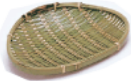
19-913 青蛤(大) 19x15.5cm 19-868 青蛤(小) 16.5x12.5cm