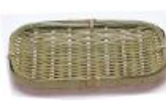
19-993 青角長 17x11.5