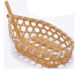
19-119-01 晒六ツ目舟(大) 18x10x3x8