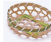
19-004 グリーン六ツ目丸c φ10x2.5