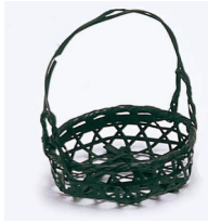
19-922 染六ツ目柄付 φ10x3.5