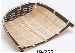
19-255 ゴザ目箕c 12x10