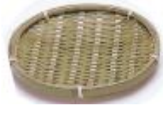
19-872 青丸 φ15cm