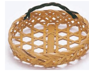
19-703 晒六ツ目カズラ φ11x2