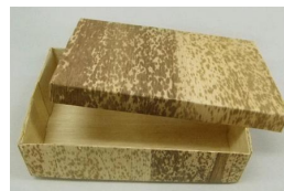
19-024 竹皮容器c 01 身18x12x5 蓋19x13x2 02 身22x9x4 蓋23x10x2