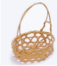
19-921 晒六ツ目柄付 φ10x3.5