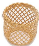
24-100 ヒレ酒カバー φ6.5x6.5