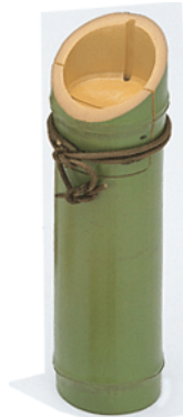
36-848 若竹酒器 φ7x28