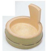
36-642 片手桶皿 φ11x4.5x10