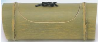
36-461 くりプタ 26.5x10x9