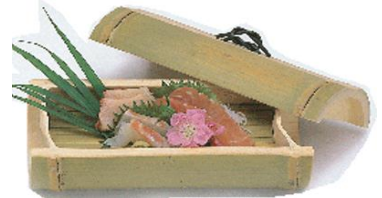
36-635 脇フタミス付 24.5x12x10