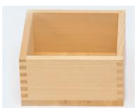
33-614 福マス 10 一升17角x9.5 01 一合8.5角x5.5 05 五合14角x7.5