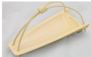
36-640 舟形皿柄付リング付 11x24x12cm