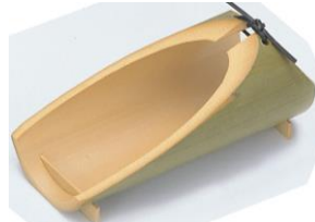
36-637 長満月皿 20x9.5x10