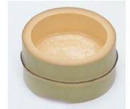
36-850 タライ皿 φ10x6