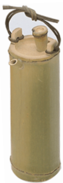
36-845 青竹酒器 φ8x24