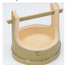
36-567 青竹手桶皿 φ12x11x4.5x13