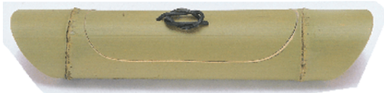
36-638 舟型フタ付 36x7.5x7