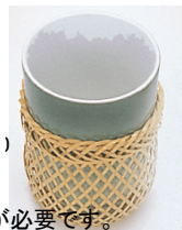
36-235 青竹つくばい φ12.5x6x12cm