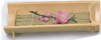
36-649 一節スノコ皿 24.5x12x4.5