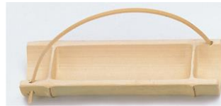
36-574 二節柄付皿 21.5x8.5x10