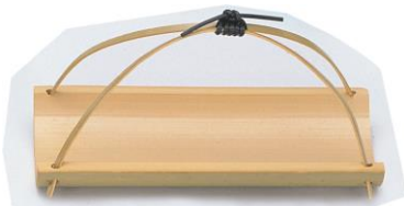
36-558 柄付大皿 24.5x11x3.5x13