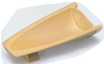
36-639 舟形皿 23x10.5x5