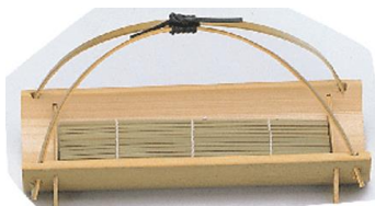
36-557 柄付大皿ミス付 24x12x4.5