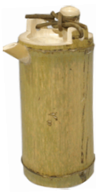
36-845-03 青竹酒器小 φ8x16