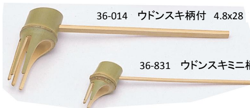
36-014 ウドンスキ柄付 4.8x28