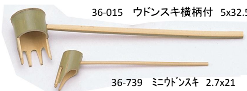
36-015 ウドンスキ横柄付 5x32.5