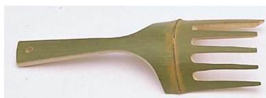
36-012 ウドンスキジャンボ 7.5x23.5