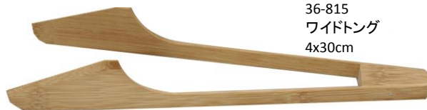
36-815 ワイドトング 4x30cm