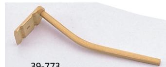
39-773 白豆腐レンゲ 4x16.5