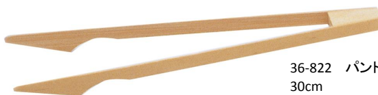
36-822 パントング 30cm