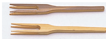
36-795 スス豆腐 15.5cm 36-794 白豆腐 15.5cm